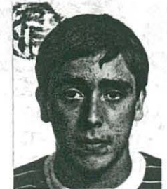
VICENT MUÑOZ CAS A RESOLDRE